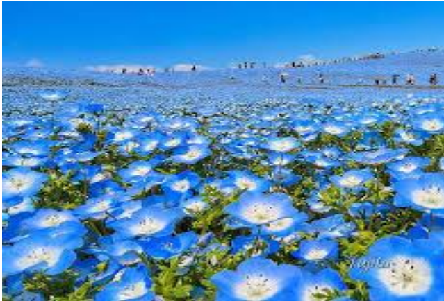
ネモフィラ (ひたち海浜公園/4月中旬~5月連休)